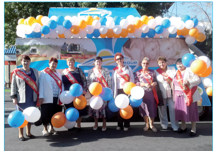
▲ Ветераны предприятий Агропромышленной группы БВК.

лающие смогли полакомиться вкуснейшими блюдами, приобрести душистый мёд, купить диковинные сувенирные вещицы умелых мастеров. На выставке-ярмарке прошли познавательные мастер-классы по рукоделию, все желающие могли познакомиться с народными костюмами, ремёслами, местными обычаями, играми. Насыщенная программа прошла под звуки задорных частушек, фольклорных мотивов. Весь день шли праздничные мероприя-