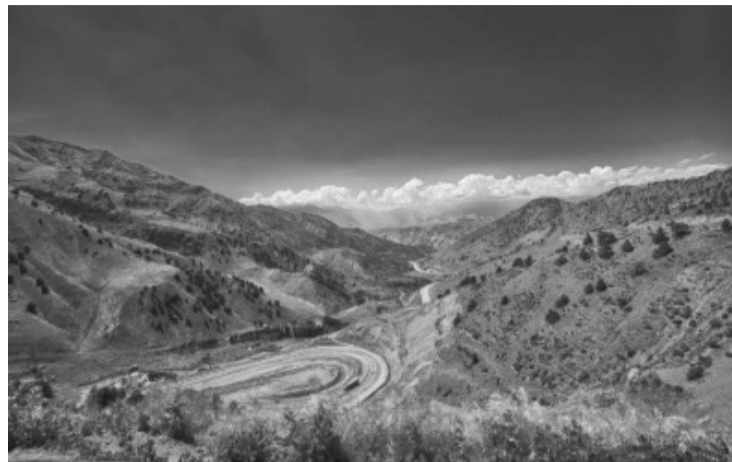
Узбекистан, г. Фергана